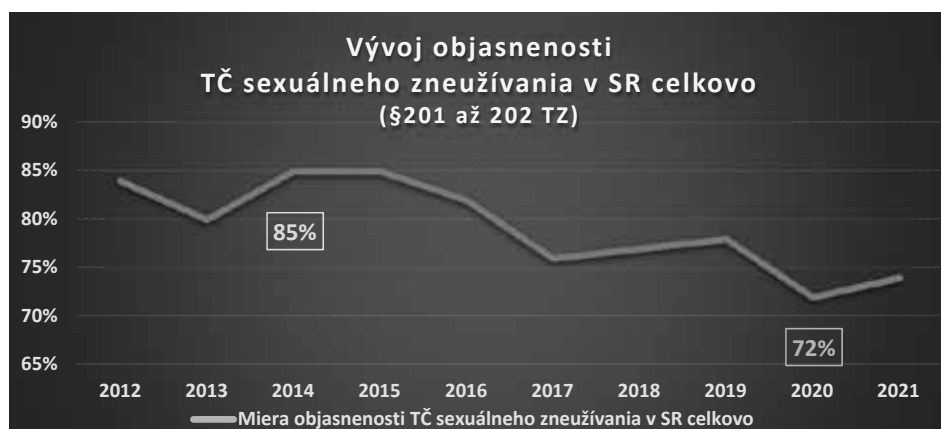
Graf č. 2: Vývoj miery objasnenosti TČ sexuálneho zneužívania celkovo v SR r. 2012 – 2021